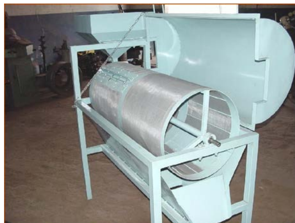
Crible rotatif